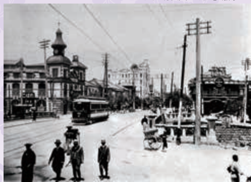
明治の銀座風景：新橋より銀座通を望む