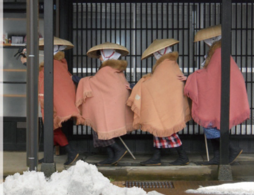
昨年冬、大野五丁目旧今井染物屋前蔵木にて