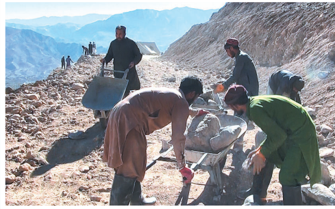
アフガニスタンの新たな用水路建設現場