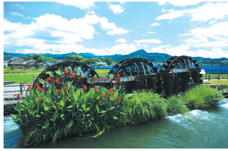
農業遺産の三連水車