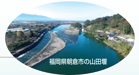
福岡県朝倉市の山田堰