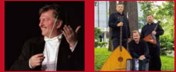
アナトリー・スミルノフ ウラジオストク・ロシアン・トリオ