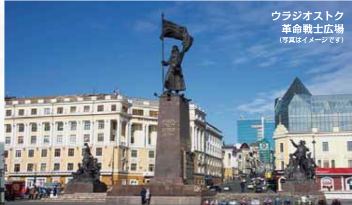
ウラジオストク 革命戦士広場 (写真はイメージです)

ロシア極東に明るい春の日差しあふれる6月、音楽と出会いの旅に、ぜひご参加くださいますよう、お誘い申し上げます。