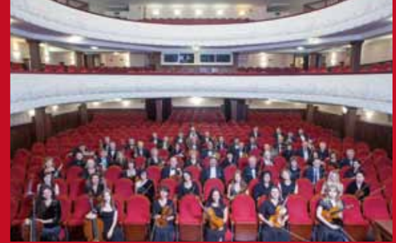
ロシア太平洋交響楽団(ウラジオストク公演)

1935年創設。オペラ「蝶々夫人」「椿姫」「エフゲニー・オネーギン」ほか、「極東春の音楽祭」「アジア太平洋クラシック音楽祭」「国際ジャズフェスティバル」、その他、2012年 APECサミットで祝賀演奏。指揮者アナトリー・スミルノフ。